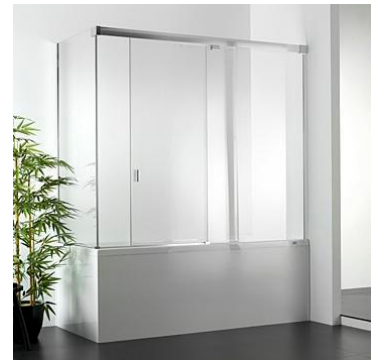
PORCELANOSA. Yove 9B Ref. 10011255