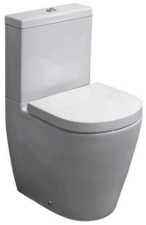
PORCELANOSA. Inodoro Acro Compact Ref. 100160761