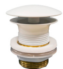
PORCELANOSA. Válvula vaciador SP Ref. 100143622