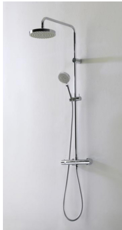
Grifería ducha PORCELANOSA. Columna smart termostática Ref. 100119809