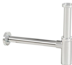
PORCELANOSA. Sifón round SP Ref. 100106048