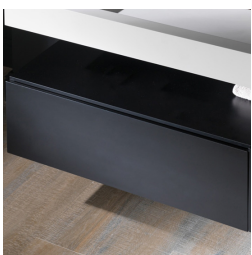
PORCELANOSA. Cajón MB Ras 110 negro Ref. 100154308