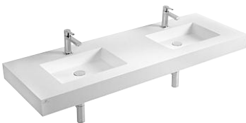
PORCELANOSA. Kole 130*50 BI Ref. 100055785