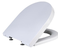
PORCELANOSA. Asiento inodoro Acro Ref. 100123832