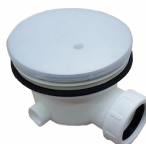
PORCELANOSA. KIP desagüe S/PIP Project Ref. 100060526