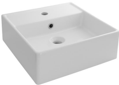
PORCELANOSA. Lavabo Jam 40 cm blanco Ref. 1000090125