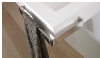
PORCELANOSA. Toallero Kole inox corner Ref. 100102362