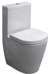
PORCELANOSA. Inodoro Acro Compact Ref. 100160761