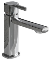
Grifería lavabo PORCELANOSA. NK Concept Ref. 100130995