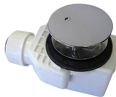
PORCELANOSA. KIT DESAGÜE AUT L-58 Ref. 100060498