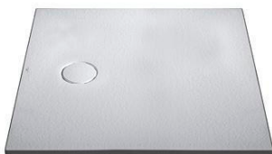
PORCELANOSA. Land Stone+desagüe medidas obra Ref. 100112281