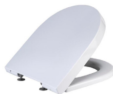
PORCELANOSA. Asiento inodoro Acro Ref. 100123832