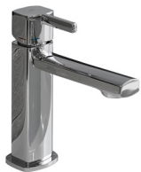
Grifería lavabo PORCELANOSA. NK Concept Ref. 100130995