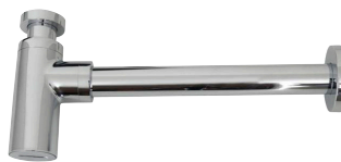
PORCELANOSA. Sifón Hotels Ref. 100101722