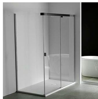
PORCELANOSA. Yove 9C Ref. 100111192