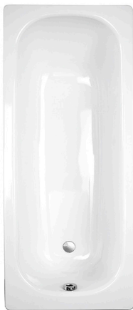
PORCELANOSA. Acore medidas de obra Ref. 100052758