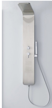
Grifería ducha PORCELANOSA. Columna Laus termostática Ref. 100119809